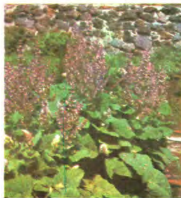
935. Шавлія мускатна.